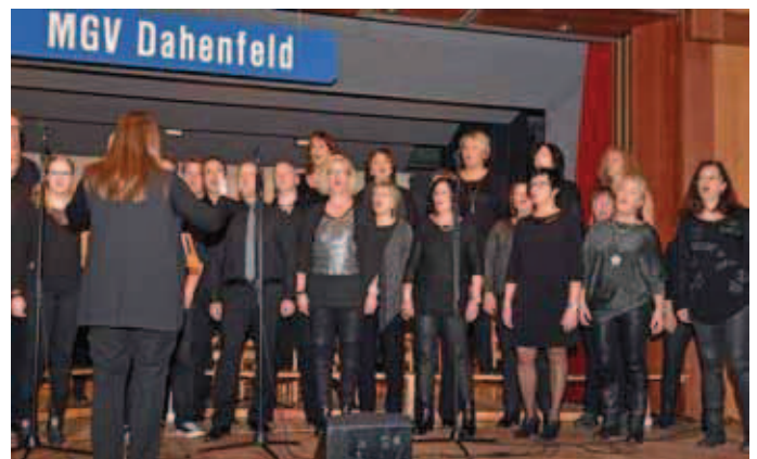
Auch bei der Weihnachtsfeier servierte daChor ein buntes Programm