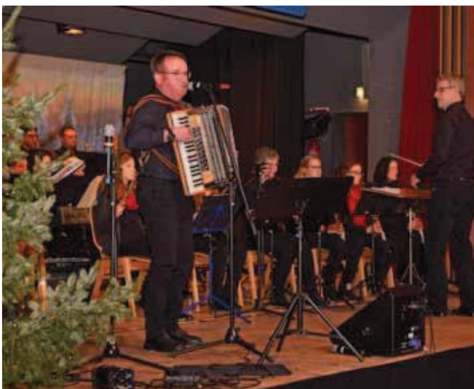
In Dahenfeld sind sie „dahoom“, die Sänger des MGV