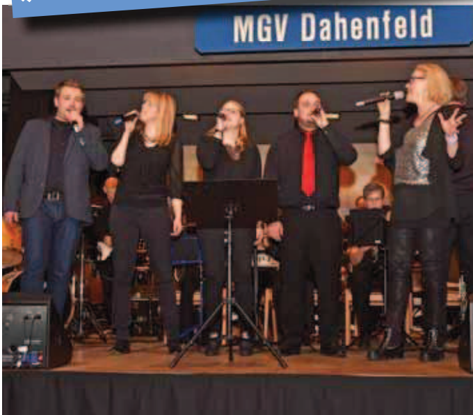
Solisten auf der Bühne, die Dahenfelder haben Sänger für jedes Genre