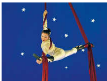
Bei so viel Körperbeherrschung sind Profis am Werk

Dass die Feier in einer offenen Manege stattfinden konnte, verdanken die Dahenfelder der Grundschule, die sich einen Mitmachzirkus schon lange wünschte und dem Stadtjubiläum, das mit zusätzlichen Geldern für die Stadtteile die Finanzierung sicherte.