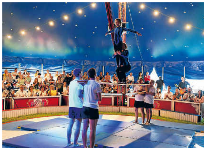
Die Turnabteilung zeigte eine reife Leistung Foto: Peter Klotz

Dann kamen Standing Ovations und die gemeinsam gesungene Hymne „Ich bin ein Dorfkind“ - vielleicht das Geheimnis von Dahenfeld. (Text und Fotos pek)